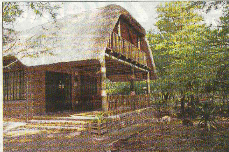
Vakantiehuis Mhofu in Marloth Park: bush rondom.

De belastingen, het onderhoud en de reis er naartoe kosten veel geld, maar het leven daar is heel goed-